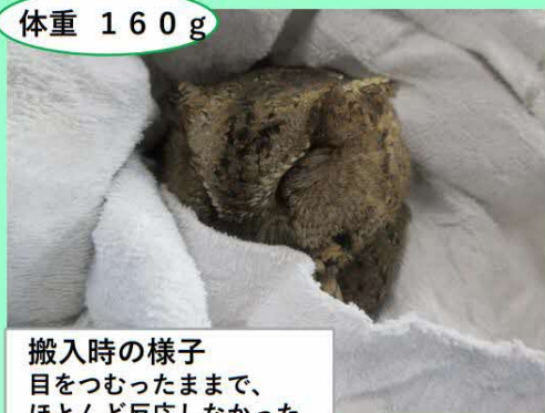
搬入時の様子 目をつむったままで、 ほとんど反応しなかった