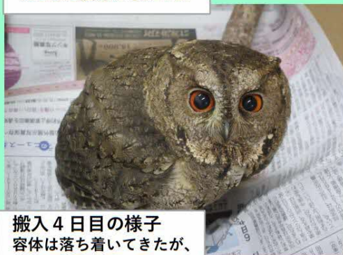
搬入 4 日目の様子 容体は落ち着いてきたが、 両目の視力は失っていた