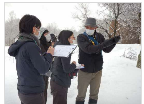
実際に活動しているボランティアさんからレクチャーを受ける参加者

当日は館内でレクチャーを行なった後、自然観察路を歩き「自然情報収集調査」を体験いただきました。途中で聞こえたツグミやコゲラの声が地鳴きであることや、野鳥が食べる植物の名前等をお伝えし、調査用紙に記入いただきました。また結氷した湖上に現れたエゾシカも観察することができました。最後に、来館者向けに自然紹介カードに記入いただきました。調査に参加すると自然散策とは違った視点で自然が見えてくることや、冬の自然観察のおすすめポイントが記載されています。調査結果と共に館内に掲示します。