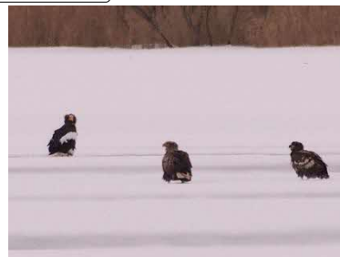
左から、オオワシ成鳥 オジロワシ成鳥、オジロワシ幼鳥

年によっては、3月上旬に湖のほぼ全面が解氷してしまうこともありますので、結氷の状況などは、センターにお問い合わせください。