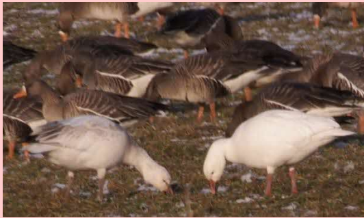
ウトナイ湖周辺の畑で採食するハクガン（後ろはマガンの群れ）

全長約 67cm。マガンやヒシクイといった茶色いガン類が多い中で名前の通り真っ白なガン。ウトナイ湖では、春の数万羽に及ぶマガン等の群れの中に数羽見られるくらいだったが、近年は目撃数が増えており、昨年 2021 年の 3 月中旬には 20 羽前後が確認された。