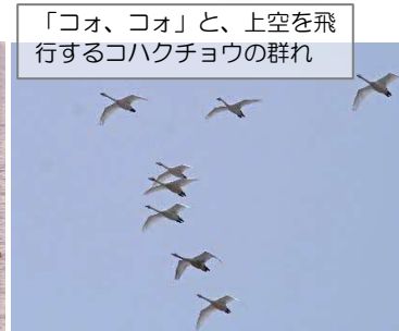
「コオ、コオ」と、上空を飛行するコハクチョウの群れ