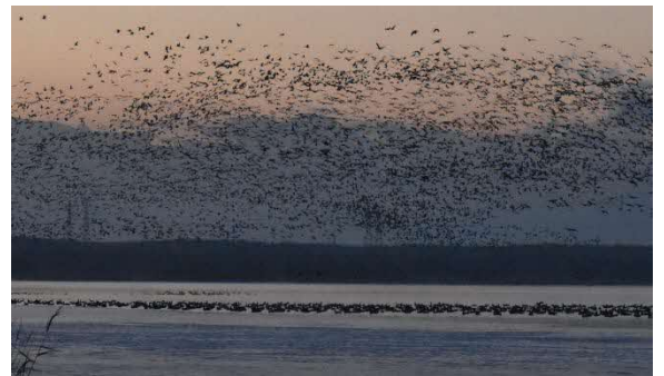
早朝のねぐら立ちの様子

春のガン類は昼間に周辺の田畑で、落穂などを採食しています。そのため、ウトナイ湖で観察が楽しめるのは、早朝と夕方です。日の出や日の入り前に湖岸沿いで待っていると、タイミングがよければ賑やかなガン類の声とともに、数万羽が織りなす壮大な景色が見られるかもしれません。どのくらい飛来しているか等の最新情報は、センターに、お問い合わせください。