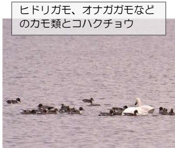
ヒドリガモ、オナガガモなどのカモ類とコハクチョウ